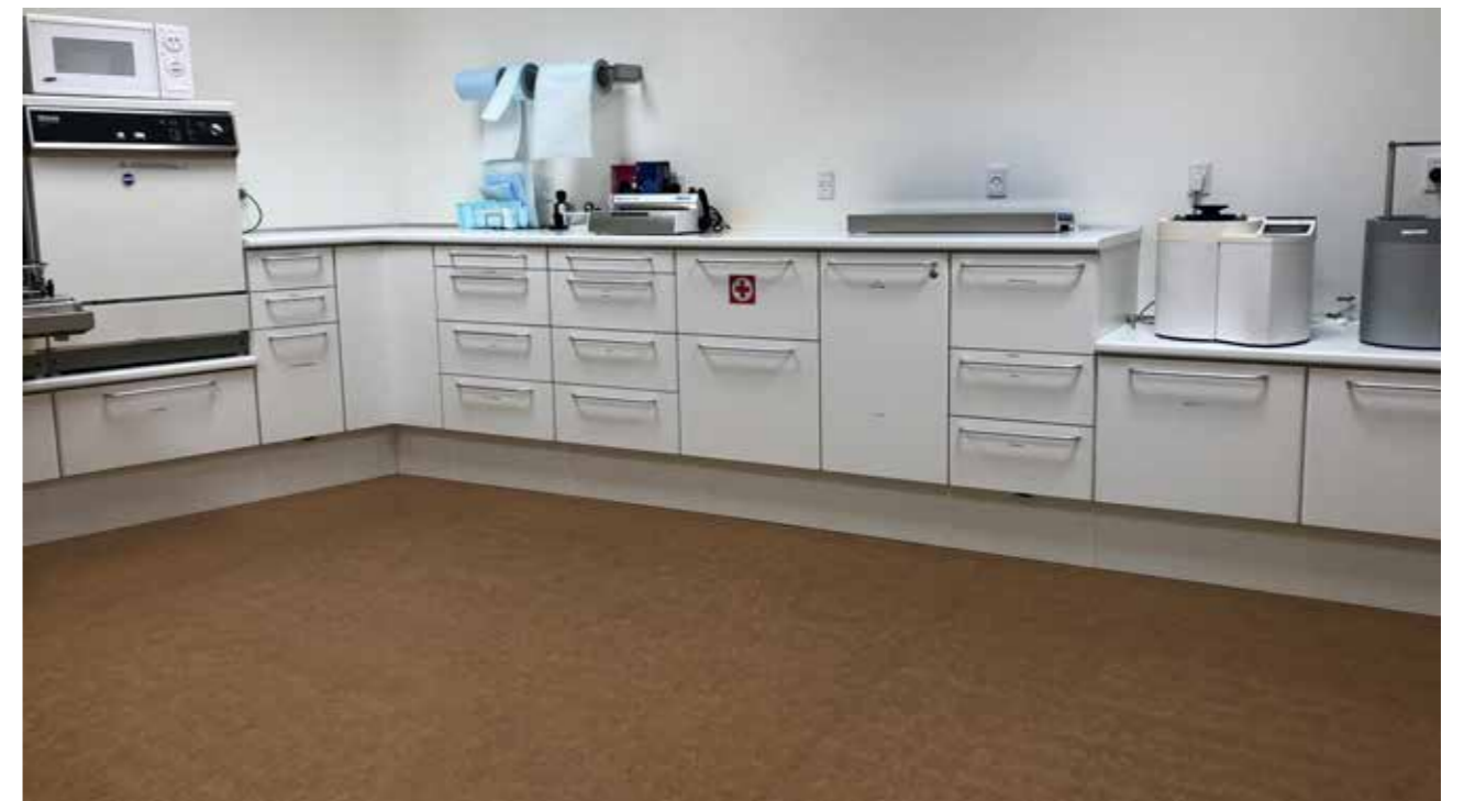
Tandplejen Hillerød kommune