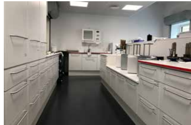
Aarhus kommunale tandpleje