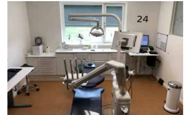
Tandplejen Hillerød kommune