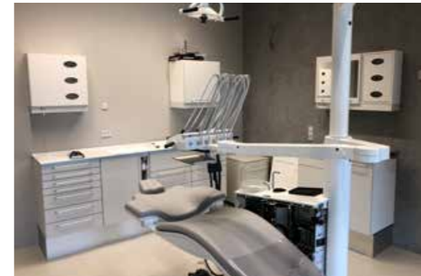
VAMS - Kbh. kommune