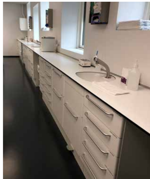
Aarhus kommunale tandpleje